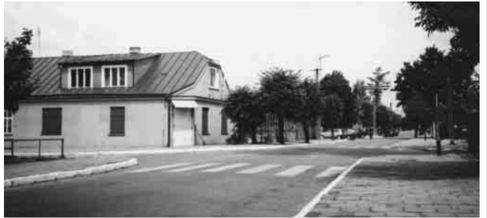
На арлянскім рынку пуста

Як сцвердзіў Славамір Нічыпарук, асобы, якія празмерна спажываюць алкаголь, часта не трымаюцца законных нормаў і прынышаў грамадскага сужыцця. Сваімі паводзінамі выклікаюць паліцыйныя інтэрвенцыі. З чэрвеня мінулага года па сёлетні жнівень працаўнікі Павятовай камендатуры паліцыі ў Бельску-Падляшскім выканалі 179 розных інтэрвенцый на тэрыторыі Арлянскай гміны. Яны затрымлівалі віноўнікаў законапарушэнняў, рэпрэсавалі ды праводзілі прафілактыку з мэтай прадукілення падобных сітуацый на будучыню. Гэтыя статывыкі паказваюць, што Арлянская гміна ў ліку перадавых у павятовым маштабе па ўзроўню бяспекі і публічнага парадку.