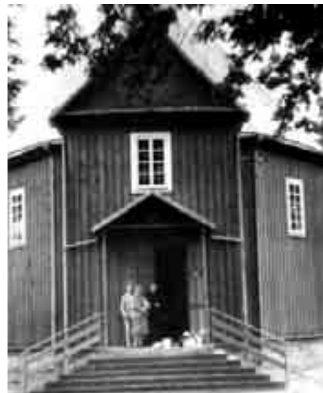
Яканюкі са святаром каля царквы ў Орлі, 1990 г.