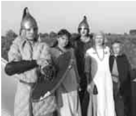
Мінулае ў Збучы 3