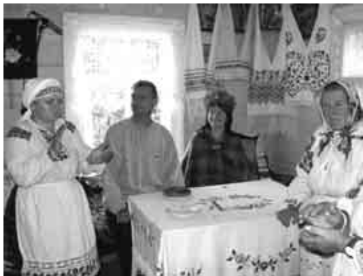
Студзіводская пара ў палескім вясельным абрадзе