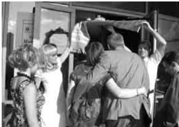
Вясельная практыка на вяселлі ў Мінску