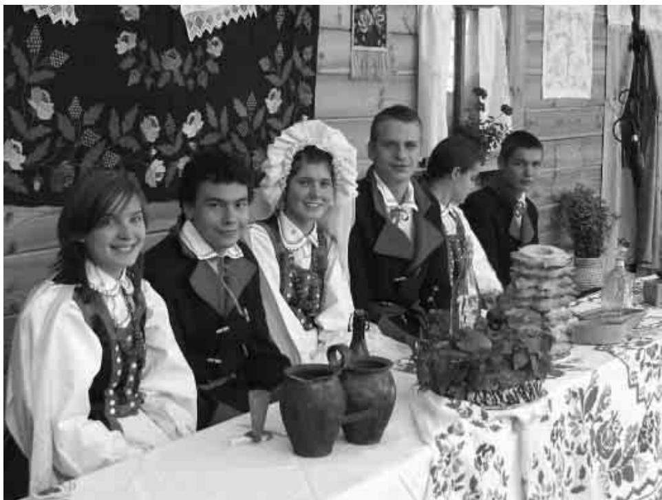
Маладая пара з калектыву „Курпянка”

„Курпянка”, канешне, з удзелам моладзі як статыстаў, паказалі скарочаныя абрады „ачэпінаў” і „вянаван-