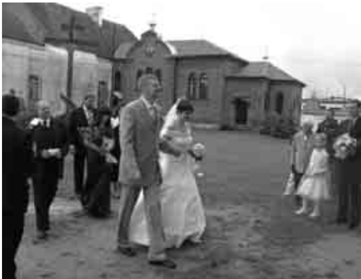
На вянец у Супрасльскі манастыр