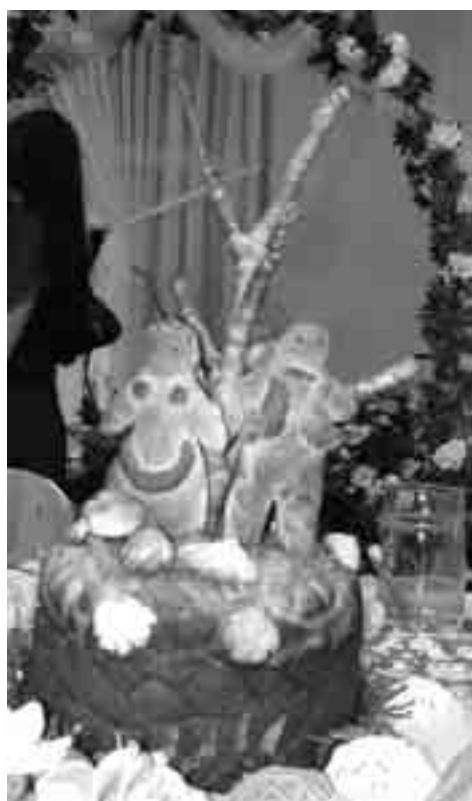
Вясельны каравай ад „Нівы”

на прыліплі да сябе. Іх сустрэчы радаваліся зямля і неба, якія прадказвалі ўдачу. Некалькі хвілін пасля спектакля мне пашанцавала сфатаграфавачь іх з каровай (пасаж-