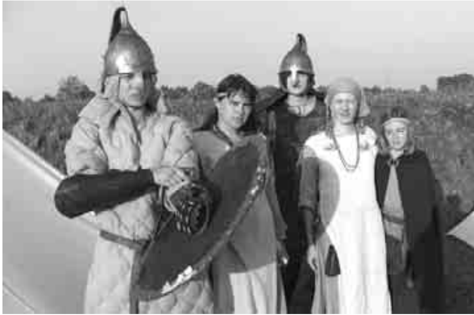
У час фэсту выступілі дзве „Маланкі”: распяваная бельская і рыцарская белавежская

Археалагічны фэст на гарадзішчы — свята не толькі для жыхароў Збуча, але і навакольных вёсак. Сёлета мерапрыемства распачалося якраз з выступаў мясцовых беларускіх калектываў — „Чыжавян”, „Збучанак” і „Незабудак”. Пазней цяжка было і злічыць выступаючыя калектывы. Можна сказаць, што сёлета фэст, які адбыўся 7 верасня, быў выключным днём у параўнанні з мінулымі гадамі, калі гаварыць пра надвор’е. У вельмі цёплы і сонечны дзень, калі тэмпература даходзіла да 30 градусаў, мноства людзей сабралася на збучкім гарадзішчы і, глядзячы на выступы, загара-