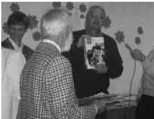
Выступае Уладзімір Колас

Час ідзе. І Беларусь, якую ўкрыжавалі, растапталі і занябалі — уваскрэсне. І думаю, не апошні ўнёсак у гэта ўнесла Таварыства беларускай культуры ў Літве, галоўная задача якога — захаванне беларускага духу Віленшчыны.