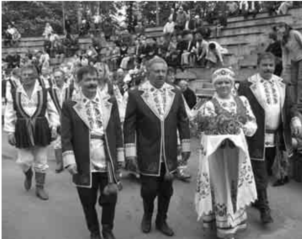
Вясельная бяседа распачалася з шэсця калектываў (на першым плане гаспадары мерапрыемства — „Рэха пушчы” — з караваем, а за імі бельскія „Васілёчкі”)

Гродзеншчыны і Бельшчыны, розніца невялікая. У выпадку песень асноўная розніца заключаецца ў вы-