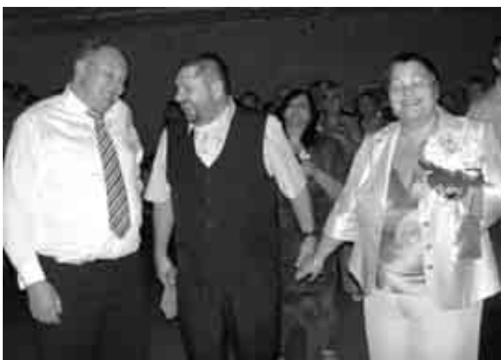
Ці не чарговая беларуска-латышская пара???

(22.04. — 20.04.) Прадбачваюцца канфлікты і непаразуменні, якія могуць скончыцца скандалам, а пачнуцца са звычайнай бязглуздыцы. У кімсьці, каго кахаеш, адкрыеш рысы сваіх бацькоў. Не рабі ўсяго сам. Не ўсе будуць табе спрыяць, але хутка разбярэшся, хто з табою.