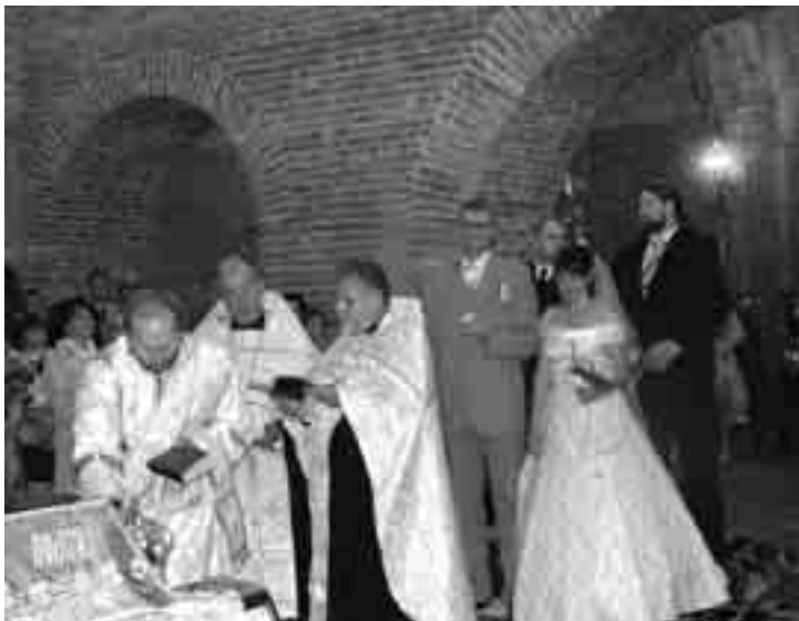
Ах, што ж гэта было за вянчанне...