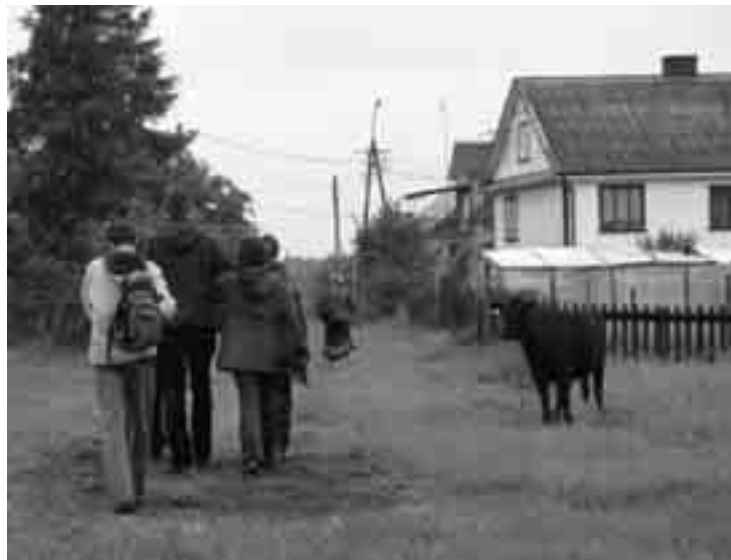
Нат студзіводскія каровы захапіліся маладажонамі