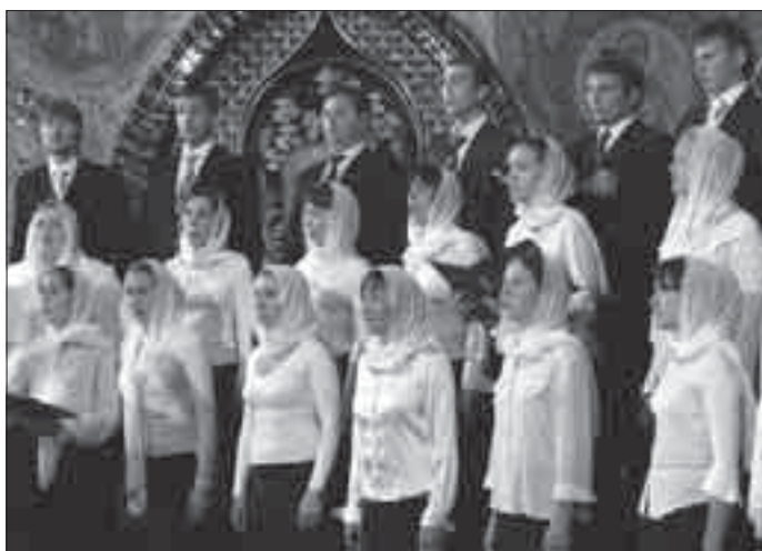
Гала-канцэрт закрыў пераможца ў катэгорыі акадэмічных выканаўцаў Хор дырыжорскага аддзялення Педагагічнага ўніверсітэта з Кіева

Парафіяльныя і свецкія хары з Беласточчыны, у якіх выступала многа беларусаў, рыхтаваліся да фестывалю здаўна і прыехалі, так як і замежныя выканаўцы, за перамогай. Гэтую задачу ў ста працэнтах выканалі харысты Мікалаеўскага праваслаўнага прыхода з Белавежы, якія занялі першае месца ў катэгорыі прыхадскіх вясковых выканаўцаў і Хор Ваяводскай камендатуры паліцыі з Беластока, які перамог у катэгорыі іншых хароў. На другім месцы сярод гарадскіх прыхадскіх выканаўцаў апынуўся Дзіцячы хор Успенскага прыхода з Бельска-Падляшскага. На трэцім месцах у розных катэгорыях было ўжо больш выканаўцаў з Беласточчыны. Яны змагаліся з харамі з усходу і захаду Еўропы і былі вышэй ацэнены конкурснай камісіяй ад часткі замежных выканаўцаў. Апошнімі гадамі гайнаўская публіка звывклася, што сярод прафесійных хароў галоўную ўзнагароду гран-пры атрымлівалі выканаўцы з Рэспублікі Беларусь.