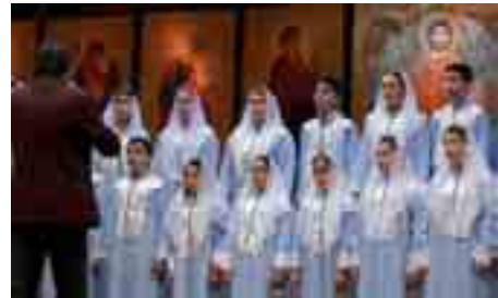
Фестывальная мазаіка 9