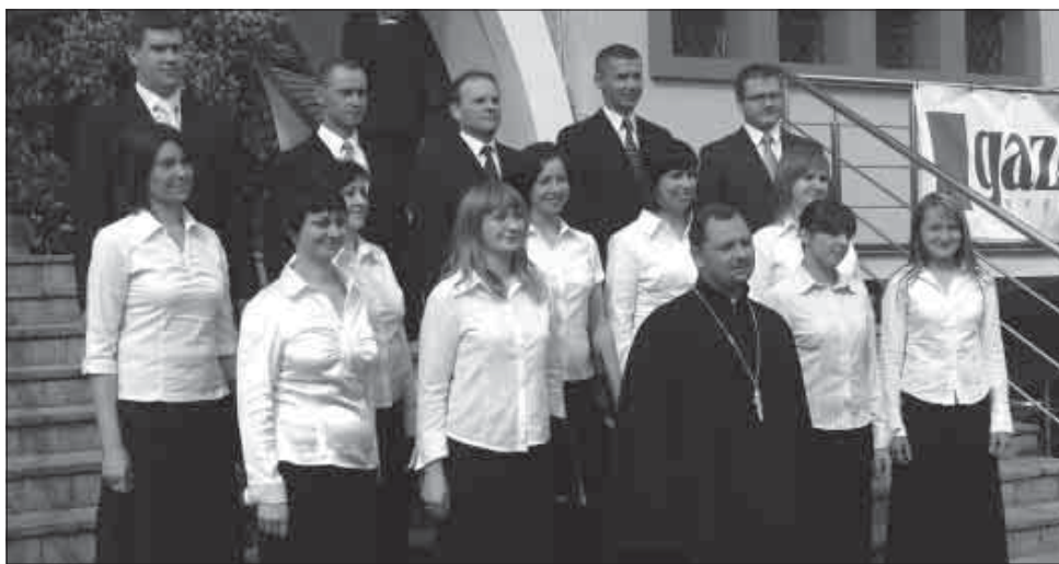
Пераможны Хор Мікалаеўскага праваслаўнага прыхода з Белавежы

Публіка захаплялася высокім мастацкім узроўнем прэзентаванай музыкі, але звяртала таксама ўвагу на яе духовасць, без якой царкоўны спеў перастае быць малітвай. Асаблівай духовасцю вылучаліся выступленні шматлікіх прыхадскіх хароў, якія пастаянна спяваюць на багаслужбах у сваіх цэрквах. Харысты, так як і іншыя вернікі, ідуць у царкву з просьбамі да Бога ў розных жыццёвых выпрабаваннях і стараюцца гэта выказаць у час малітоўнага спева. Пер-