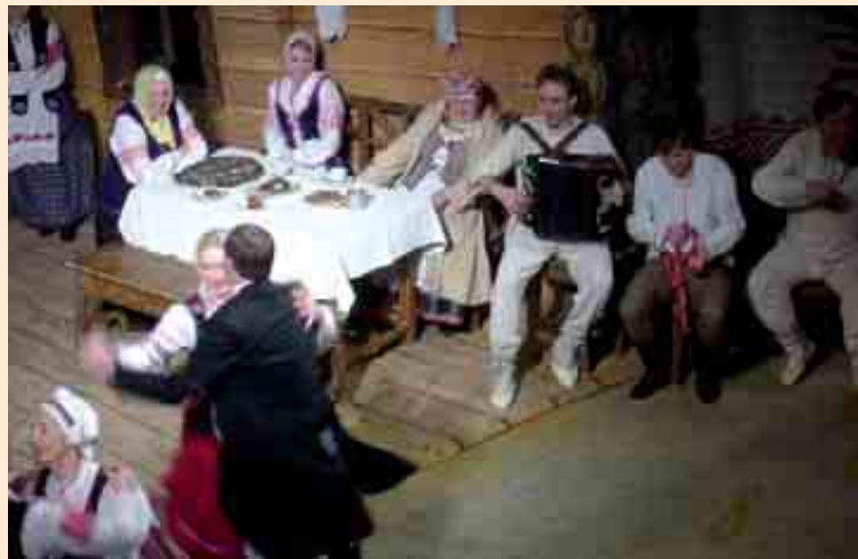
У першы дзень паглядзелі мы „Паўлінку” ў Тэатры імя Янкі Купалы