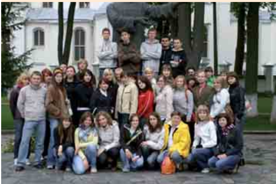
Вучні першых і другіх класаў Гайнаўскага белліцэя ў Мінску

Май — самы лепшы месяц на школьныя экскурсіі. Не забылі аб гэтым таксама настаўнікі нашага ліцэя. Яны наладзілі нам цудоўную паездку ў Беларусь. Ахвотных ехаць было шмат. У групе апынуліся вучні першых і другіх класаў. Большасць з іх упершыню мела магчымасць убачыць сталіцу Беларусі.