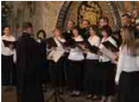
Гайнаўскія дні царкоўнай музыкі 3