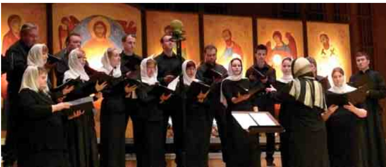
Хор сабора Нараджэння Хрыста з Рыгі (Латвія)