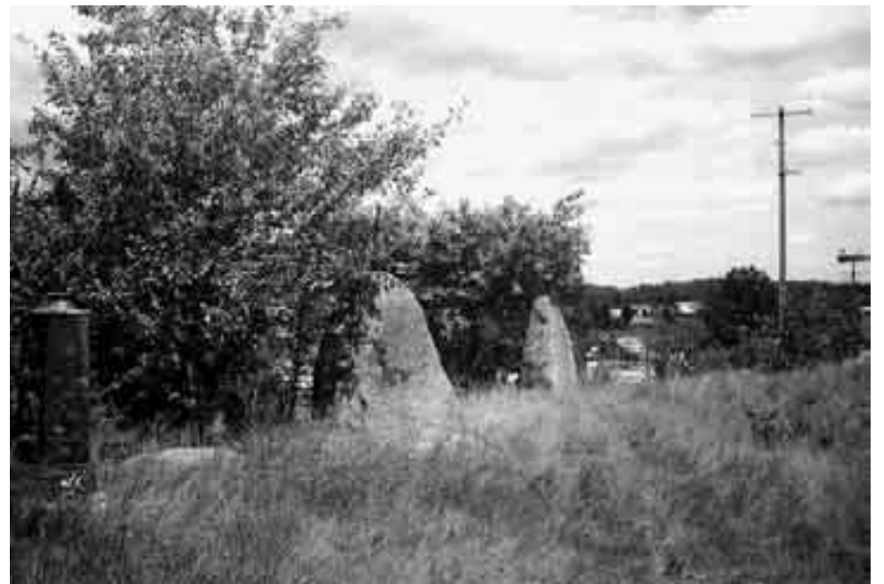
Помнікі ў Грабянях