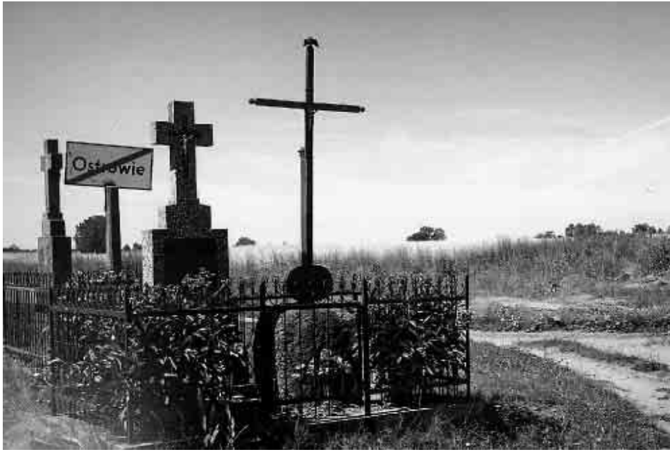
Крыжы ў Востраве; цяперашні каталіцкі крыж на другім плане