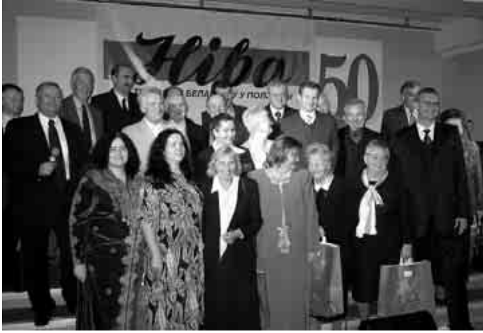
Ніўская сям'я цешыцца з сустрэчы