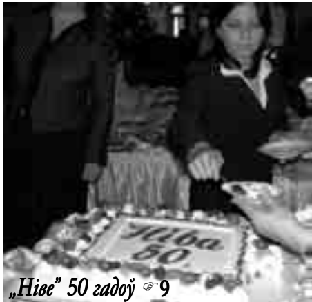
„Ніва” 50 гадоў