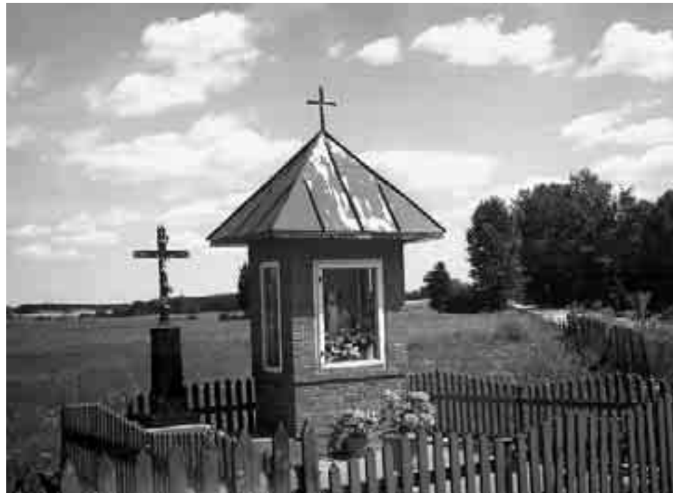
Каплічка з помнікам у Гарасімавічах

Пацвярджэнне апошніх абставін знойдзем і ў Востраве, на заходнім канцы вёскі. Тут таксама стаіць на каменным пастаменце лацінскі крыж з чыгуннай таблічкай, на якой надпіс: „Сей Крестъ поставленъ за спасение деревни Острова Поставленъ сент. 4 д. 1886 г.” Гэта