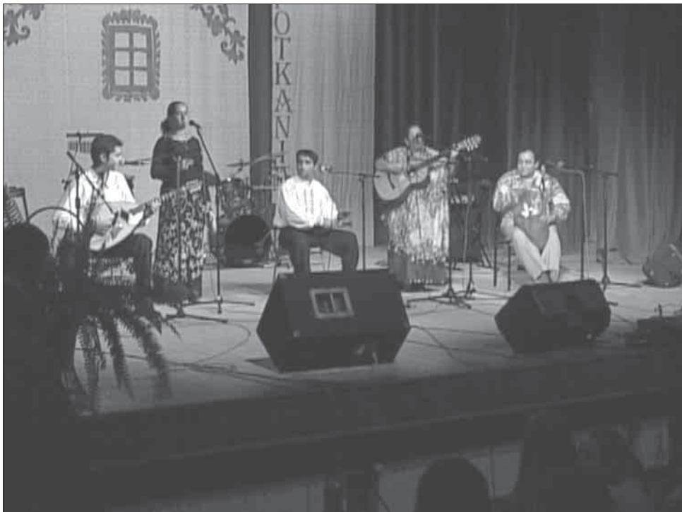
На сцэне Дома літоўскай культуры ромскі гурт „Калэ бала” з Чорнай Гары пад Кракавам