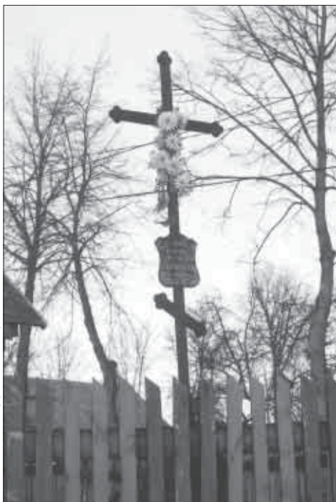
Фота АЛЕКСАНДРА ВЯРЫЦКАГА