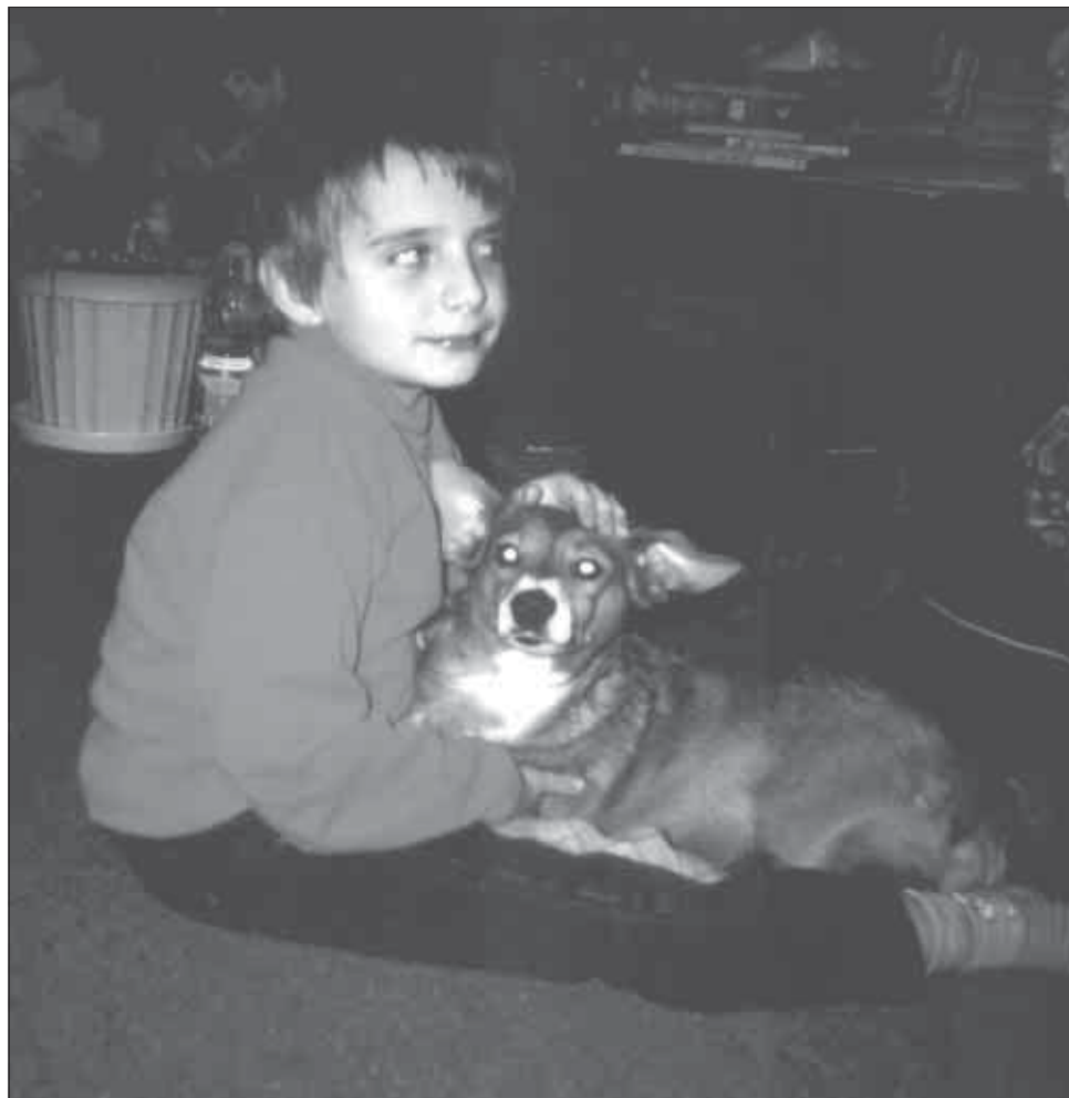
Радзік з Рэшкай

— Ведаю ўжо, як пабудавана наша сонечная сістэма. У яе цэнтры — Сонца, усе іншыя планеты кружацца навокал яго.