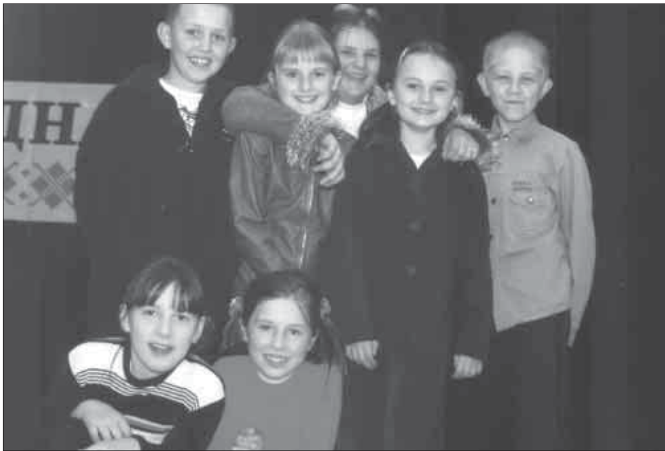
Навучэнцы беларускай мовы ў Беластоку