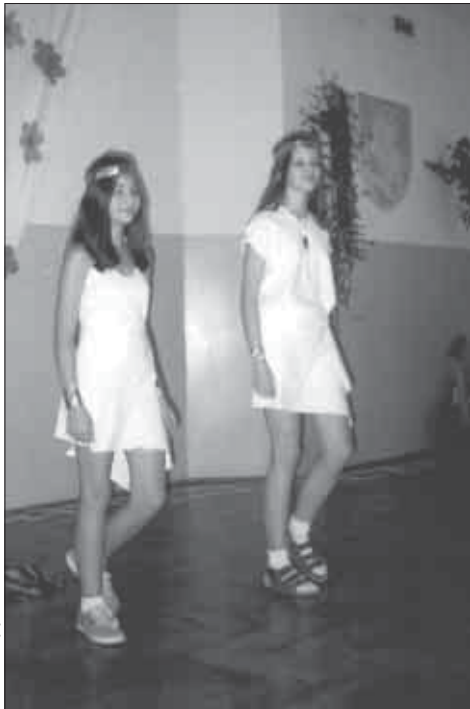
Дзяўчаты з I класа Гімназіі ў Гайнаўцы